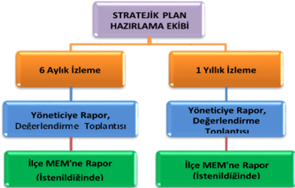
Şekil 2: İzleme ve Değerlendirme Süreci

Müdürlüğümüzün 2019-2023 Stratejik Planı İzleme ve Değerlendirme sürecini ifade eden İzleme ve Değerlendirme Modeli hazırlanmıştır. Müdürlüğümüzün Stratejik Plan İzleme- Değerlendirme çalışmaları eğitim-öğretim yılı çalışma takvimi de dikkate alınarak 6 aylık ve 1 yıllık sürelerde gerçekleştirilecektir. 6 aylık sürelerde rapor hazırlanacak ve değerlendirme toplantısı düzenlenecektir. İzleme-değerlendirme raporu, istenildiğinde İlçe Milli Eğitim Müdürlüğü'ne gönderilecektir. Ayrıca ilçemizin Mülki İdari Amirine sunulacaktır. 1 yıllık izleme-değerlendirme çalışmaları, Stratejik Planımızda yer alan hedeflerin yıllık düzeyde ifade edildiği Performans Programı ve yılsonunda gerçekleşme düzeylerinin belirlendiği Faaliyet Raporu hazırlanarak yapılacaktır.